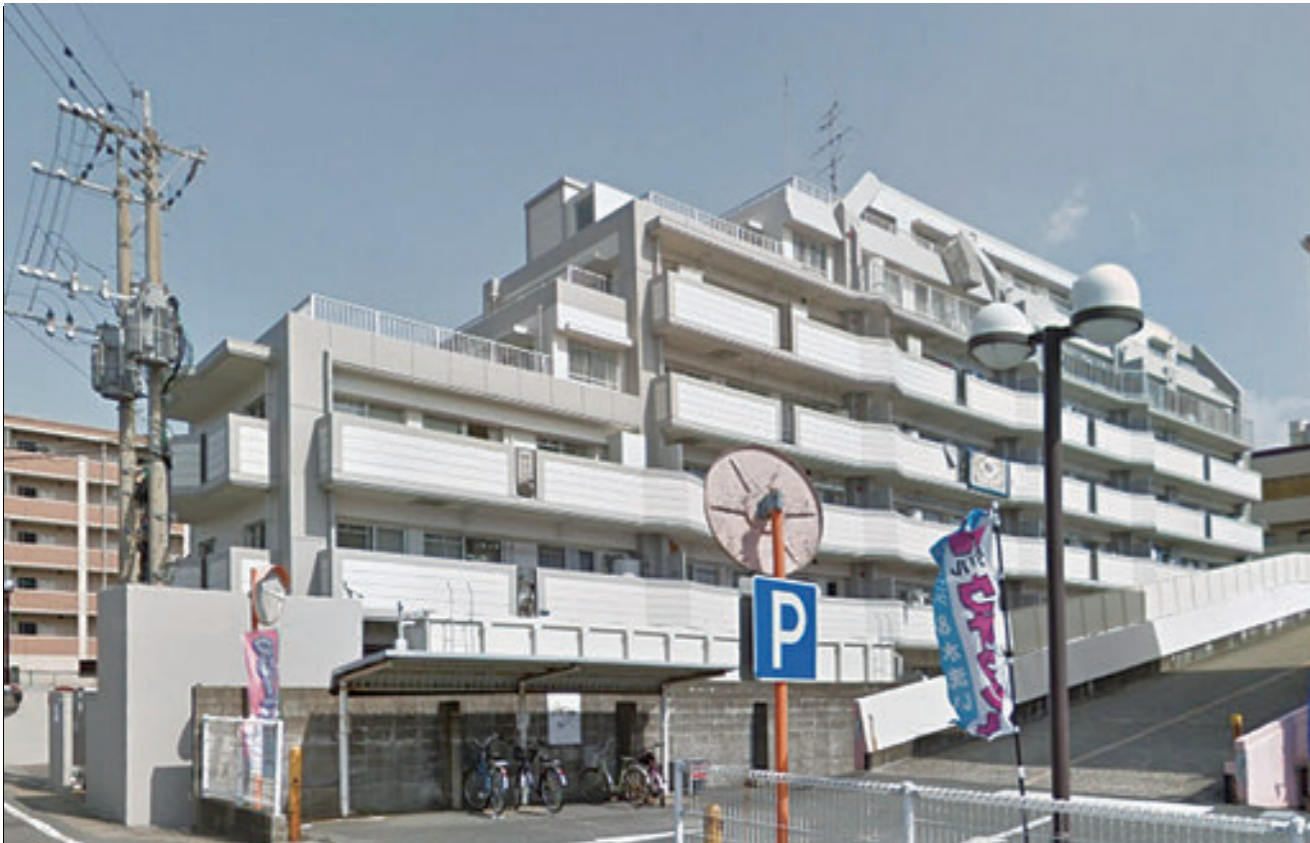
J R筑肥線「周船寺駅」までは徒歩6分。隣には西鉄ストアもあり、通勤・買物もたいへん便利です。