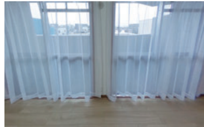
【洋室】 洋室1は9.4帖ある主寝室です。