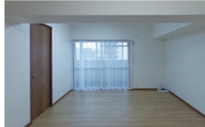
【LDK】 リビングは長方形で家具の配置も自由です。