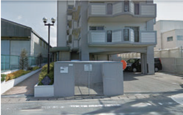
【外観】 マンション入り口の写真です。