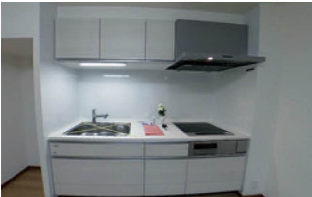
【キッチン】 新品に交換されたシステムキッチンです。