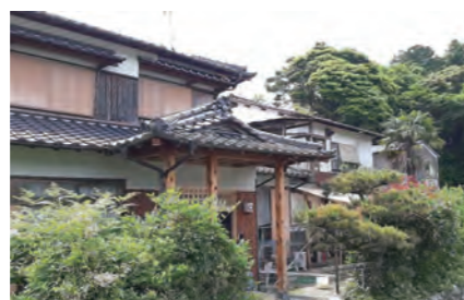
母屋の写真です。自然と調和して、ぬくもりを感じます。