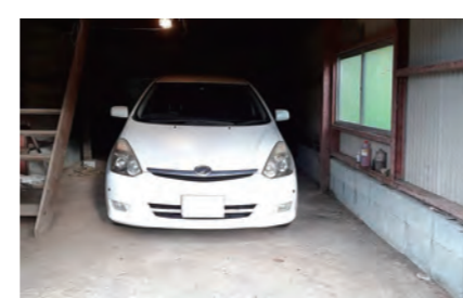
別棟の階下にある車庫になります。