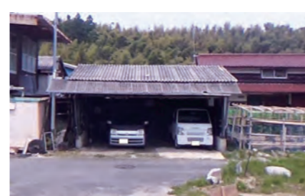
飛地の納屋の写真です。現在、車庫として利用されています。