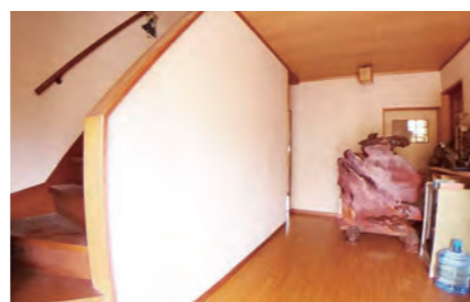
玄関を開けると長い廊下です。