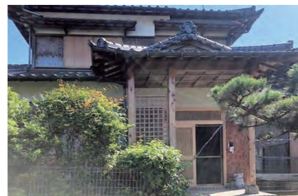
母屋の正面写真です。