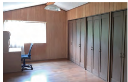
収容力がある壁一面のクローゼットです。