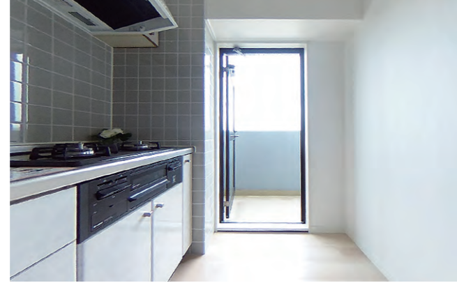
キッチン奥にもバルコニーがあり重宝します。