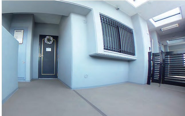
玄関入口は専用アルコーブがあり戸建感覚です。