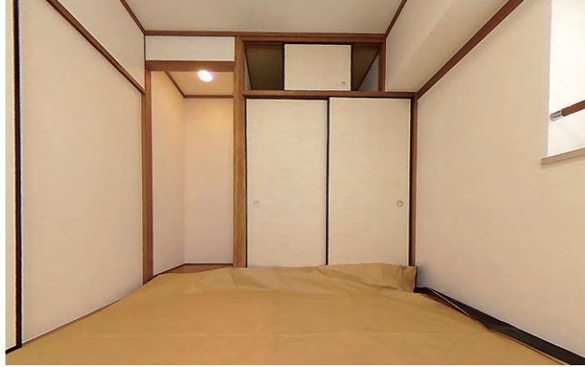
和室は角部屋で明るく、落ち着いた雰囲気です。