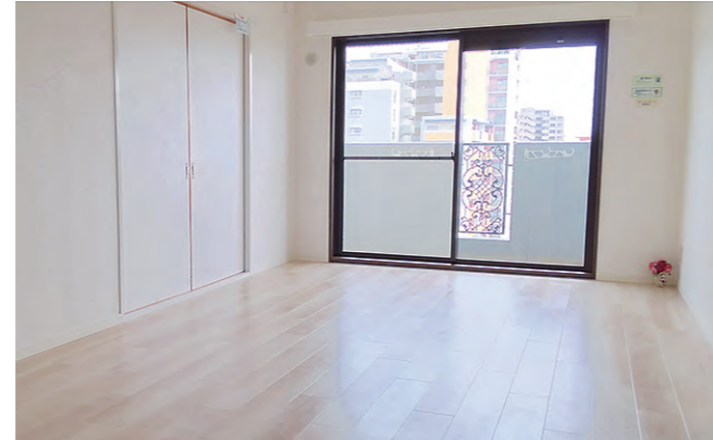
約14.2畳のLDKは南向きの明るいスペースです。